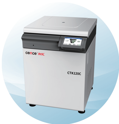
CTK120C大容量低速冷冻（自动脱盖）