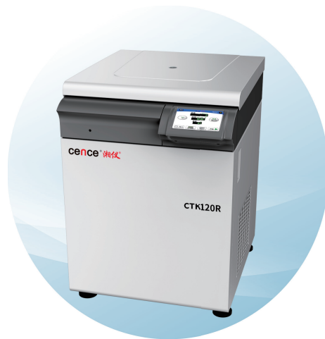
CTK120R大容量低速冷冻（自动脱盖）